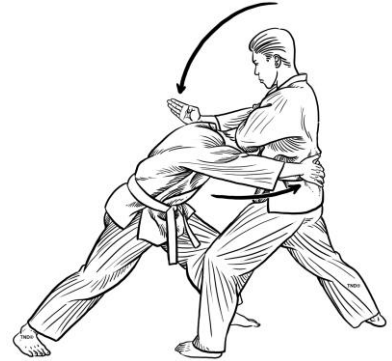
Chém lối 6

Tầm mức quốc tế : 8 ngôn ngữ trong một cuốn sách, gồm : Pháp, Anh, Đức, Ý, Tây Ban Nha, Liên Xô, Ả Rập và Việt ngữ.