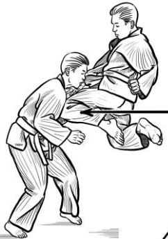
Gối lối 6