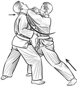
Chỏ lối 5